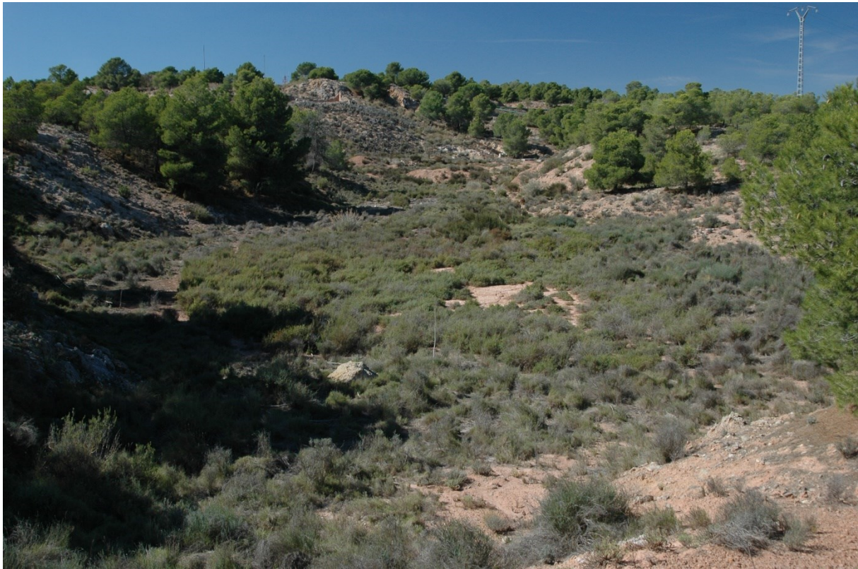
Vista de la microreserva en la qual s'observen els algeps amb presència d'espècies gipsícoles.