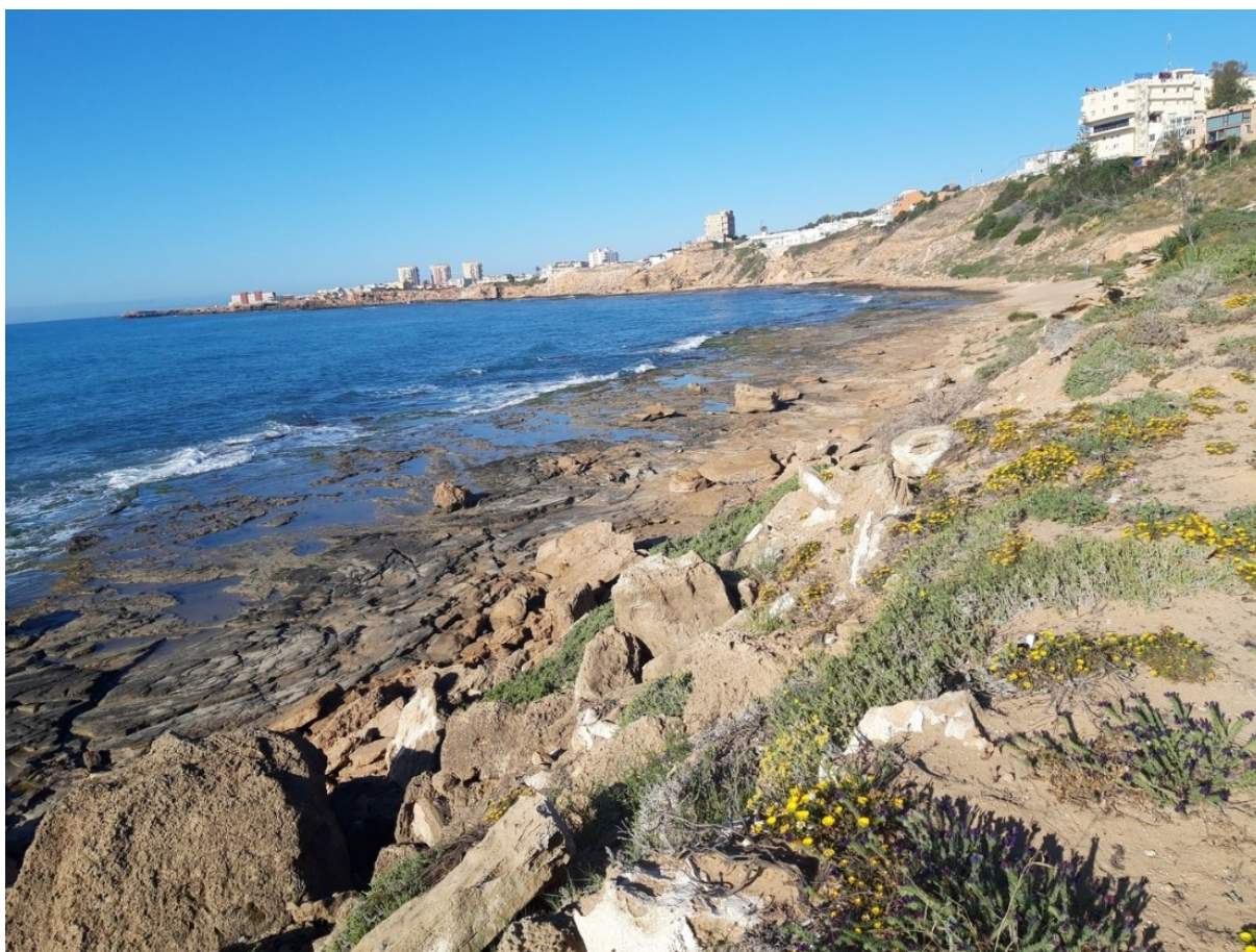
Vista de la microrreserva en la que se observa la vegetación de acantilados litorales con saladillas endémicas.