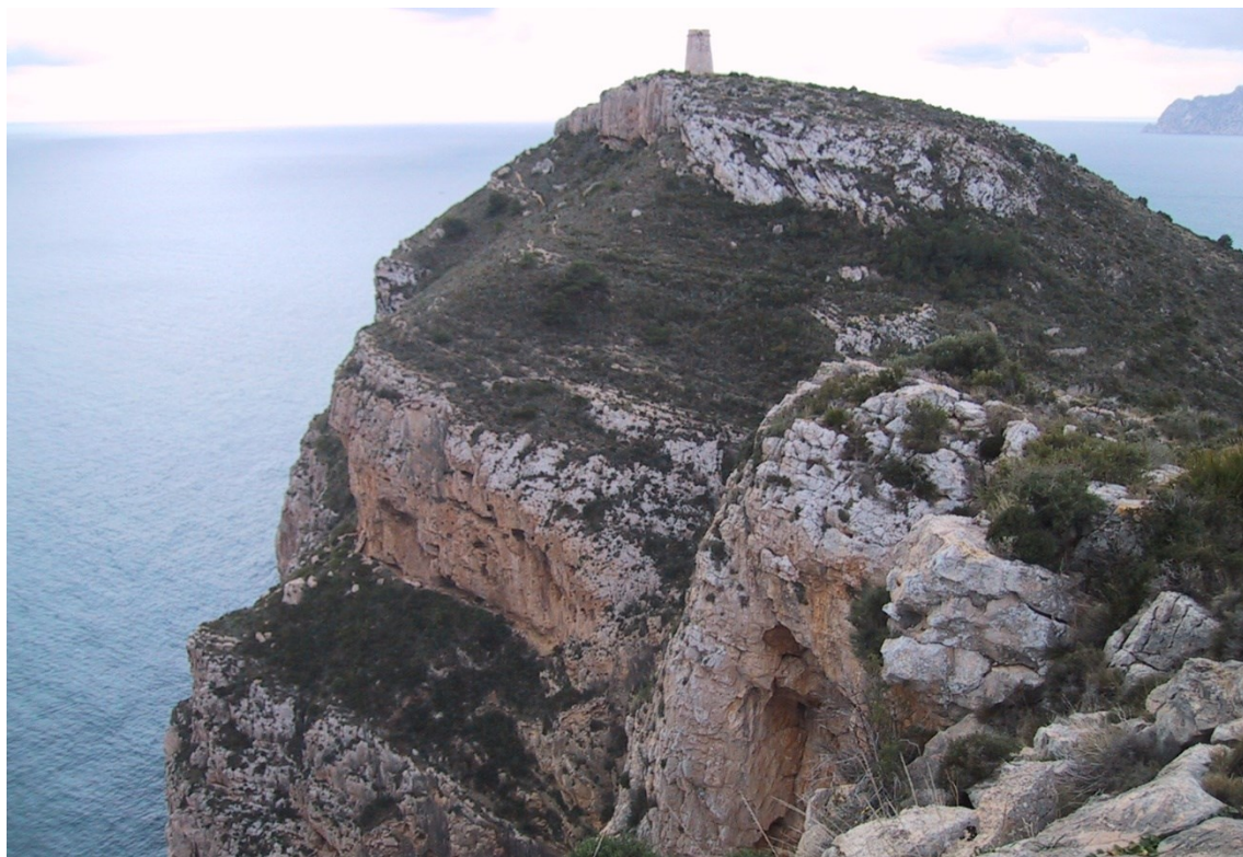
Vista de la microrreserva, en la que se observan las comunidades rupícolas y los fragmentos de matorral