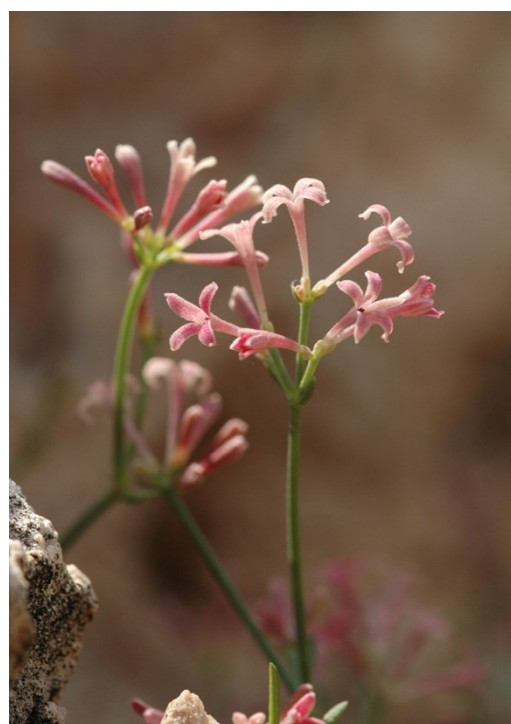
Silene hifacensis (izquierda) es una de las especies valencianas amenazadas más emblemáticas. Asperula pui subsp. dianensis (derecha) es un endemismo diánico de las sierras litorales, con una distribución que va desde Denia al Mascarat.