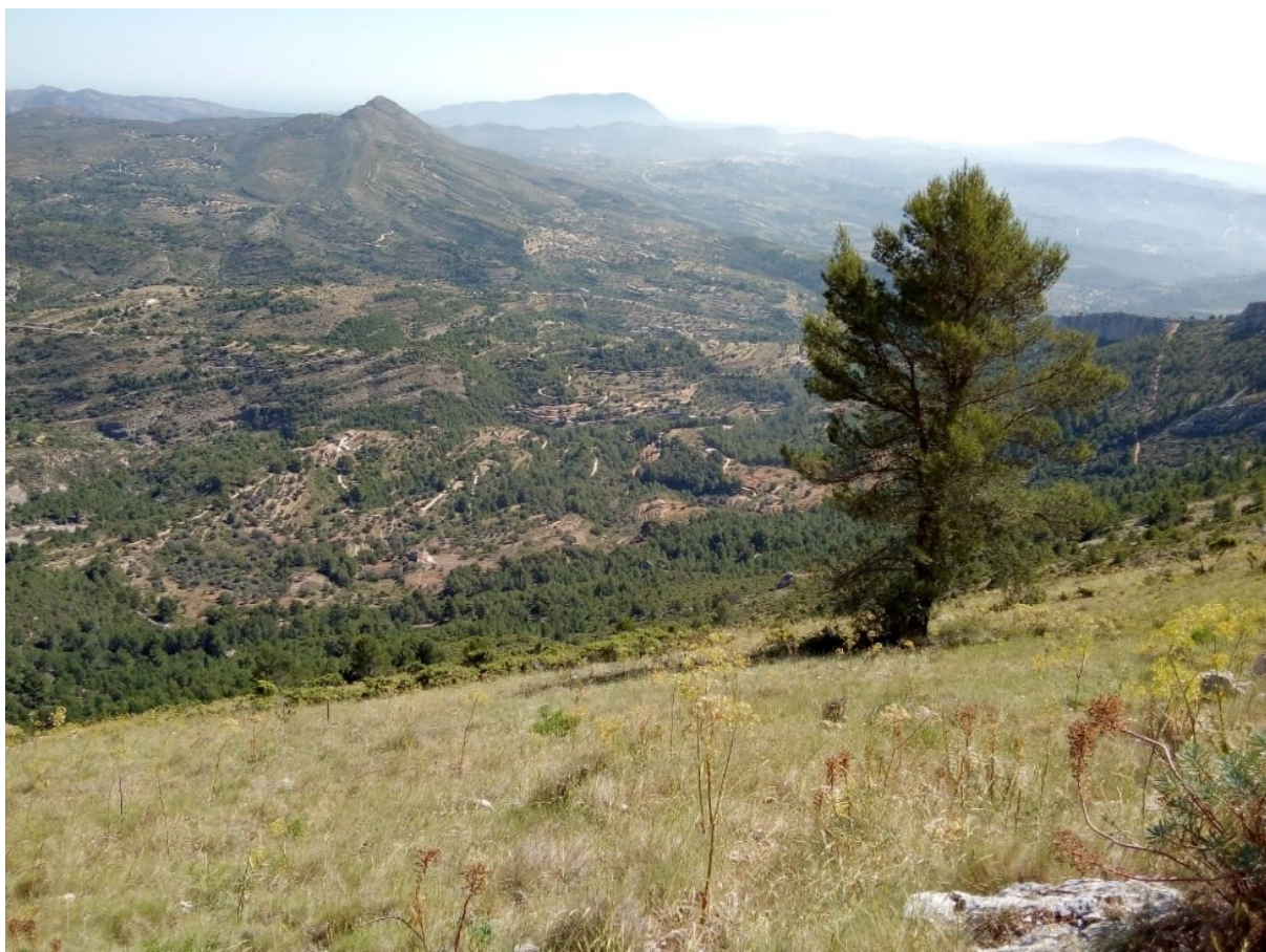
Vista de la microrreserva, en la que se observan los pastizales ricos en especies bulbosas.

http://www.dogv.gva.es/datos/1999/05/28/pdf/1999_4785.pdf