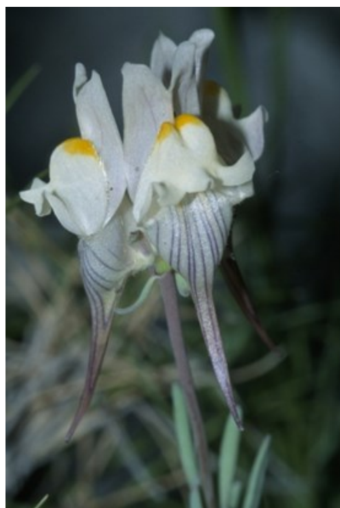
Festuca patula (izquierda), gramínea muy rara y escasa en el territorio valenciano. Linaria depauperata subsp. depauperata (derecha) es un endemismo del sector corológico Setabense.