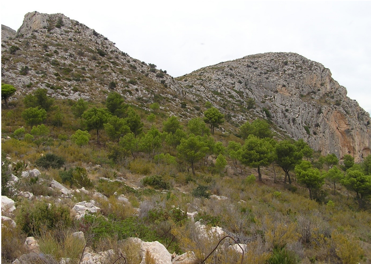
Vista de la microrreserva, en la que se observan las formaciones en mosaico de pastizales y matorrales.