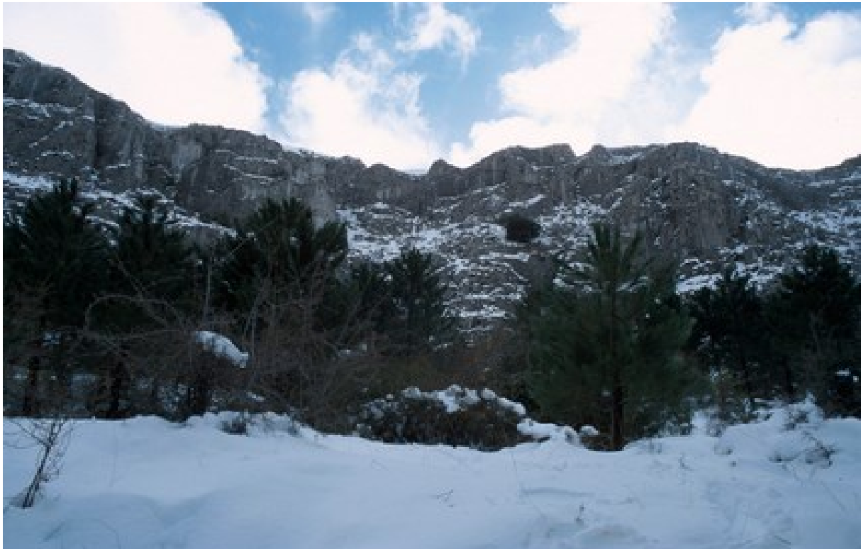
Vista de la microreserva, en la qual s'observen les comunitats d'espècies rupícoles i els boscos mediterranis amb teixos.

http://www.dogv.gva.es/datos/2010/06/10/pdf/2010_6390.pdf