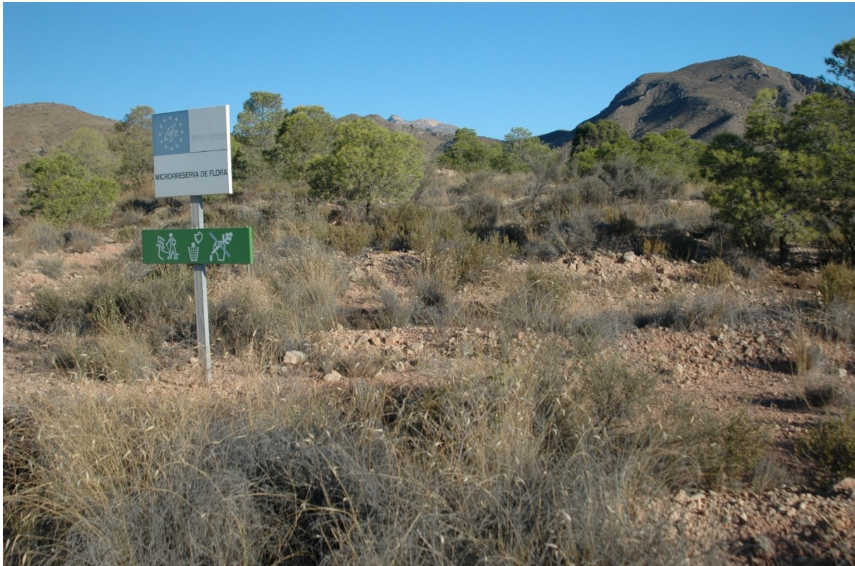
Vista de la microrreserva, en la que se observan los albardinales y las comunidades de gipsófitos.