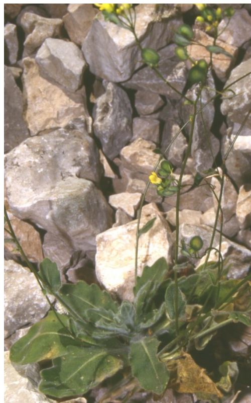
A les parets rocoses d'aquesta microreserva es poden observar aquests dos endemismes alcoiano-diànics: Brassica repanda subsp. maritima (esquerra) i Biscutella montana (dreta), que pertanyen a la mateixa família botànica, les crucíferes.