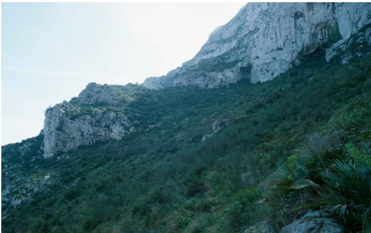
Vista de la microreserva, en la qual s'observen les comunitats d'espècies rupícoles i la màquia litoral.