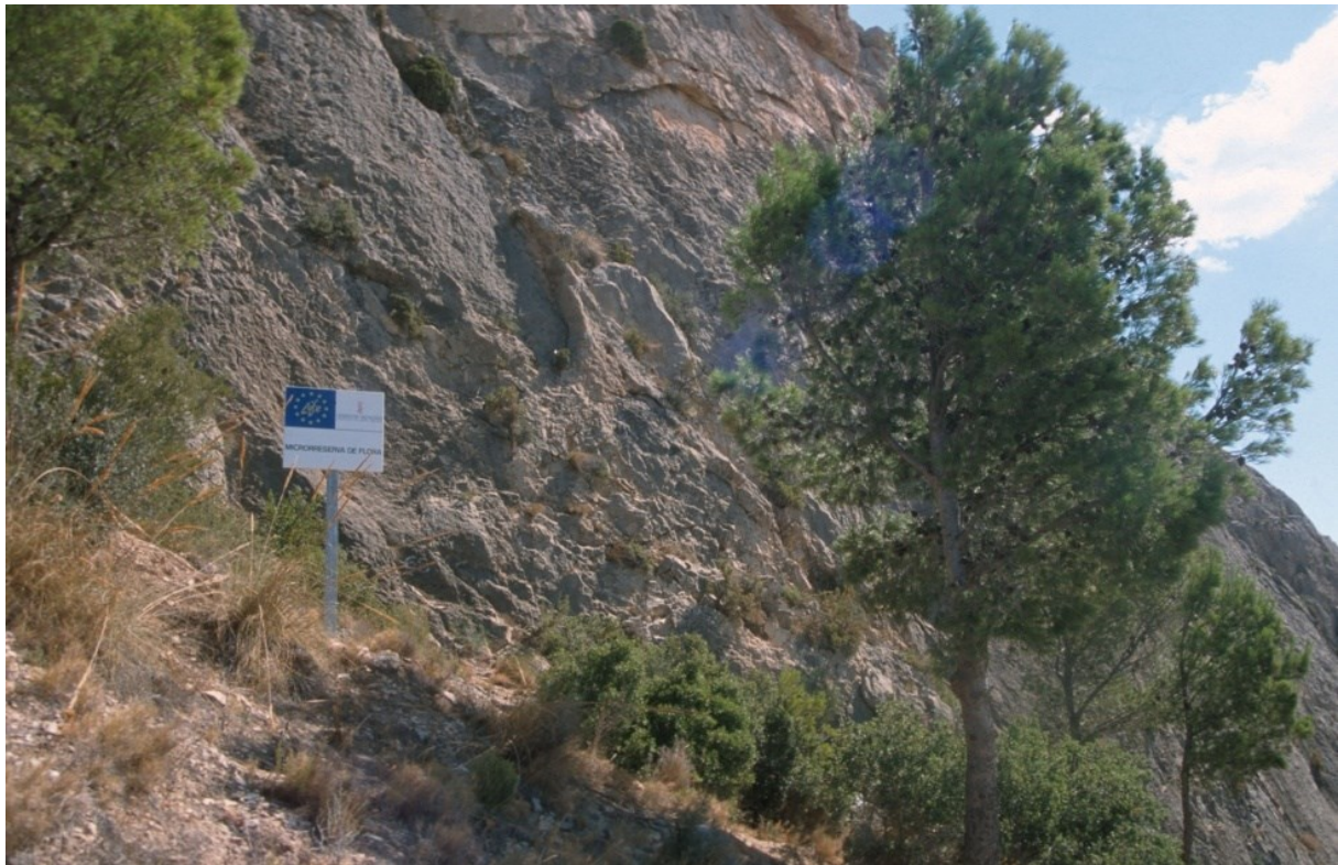
Vista de la microreserva, en la qual s'observen les comunitats d'espècies rupícoles.

http://www.dogv.gva.es/datos/1999/05/28/pdf/1999_4785.pdf