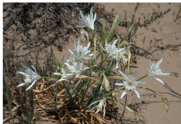
Dos de las especies psammófilas que indican un buen estado de conservación de los ecosistemas dunares: Medicago marina (izquierda) y Panocratium maritimum (derecha).