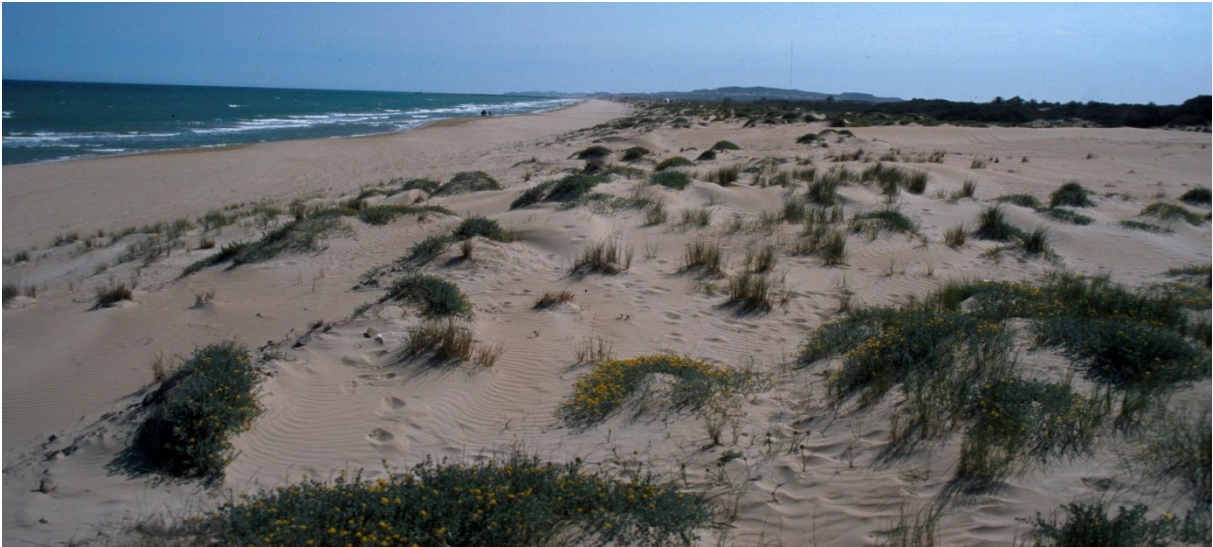
Vista de la microreserva, en la qual es poden observar les diferents comunitats psammòfiles.