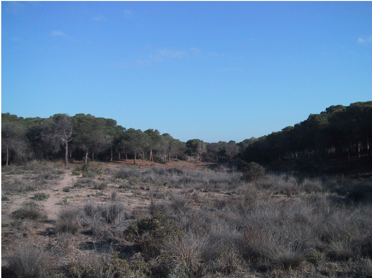
Vista de la microreserva, en la qual es poden observar les comunitats psammòfiles, de marjals intradunars i bosquets de pins.