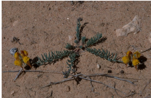
Dues de les espècies més característiques dels ecosistemes dunars., Crucianella maritima (esquerra) i Linaria depauperata subsp. hegelmaieri (dreta).

Tipos de hàbitats (Código Natura 2000)(Hàbitat prioritari*)