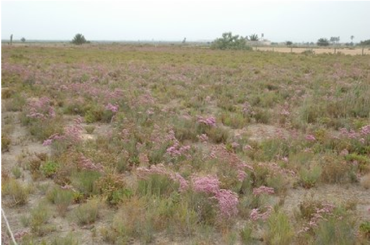
Vista de las formaciones con Limonium caesium .