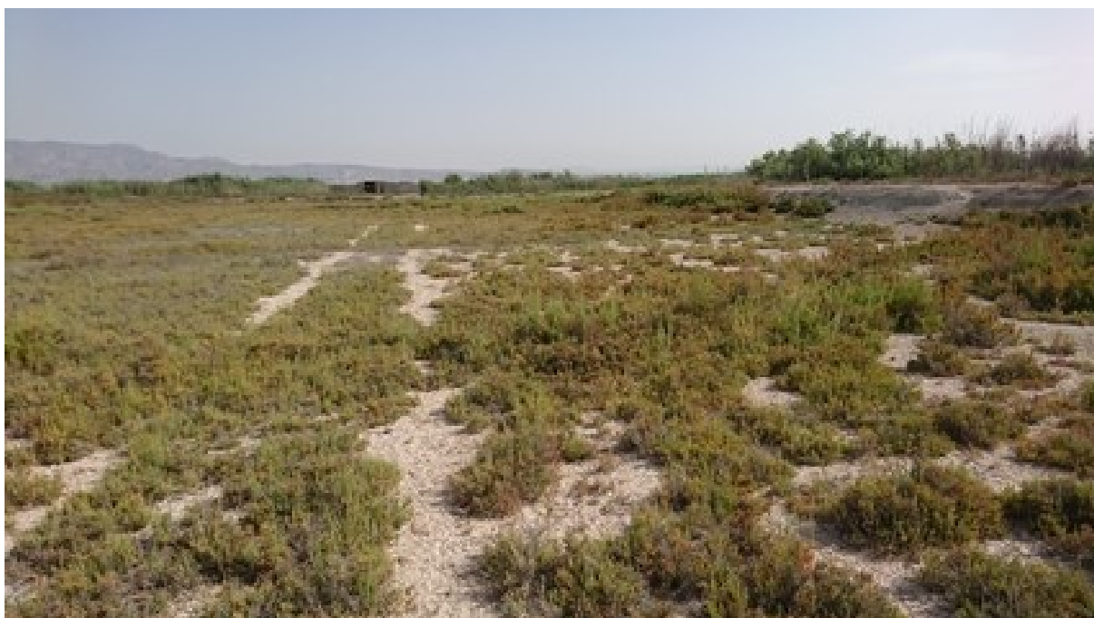
Vista de las formaciones de saladar, matorrales y pastizales salinos en mosaico.