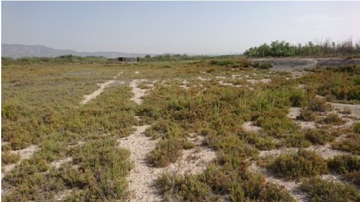
Vista de les formacions de saladar, matollars i prats salins en mosaic.