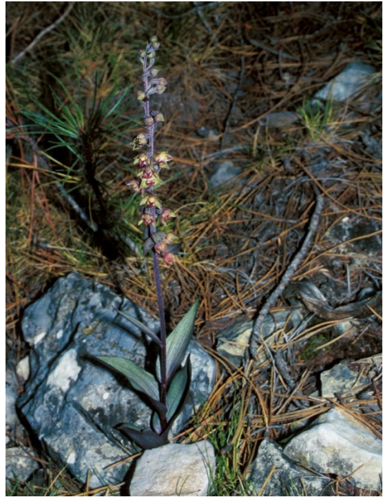
Dues espècies d'orquídies del gènere Epipactis , pròpies de boscos madurs amb una humitat ambiental elevada: Epipactis cardina (esquerra) i Epipactis kleinii (dreta).