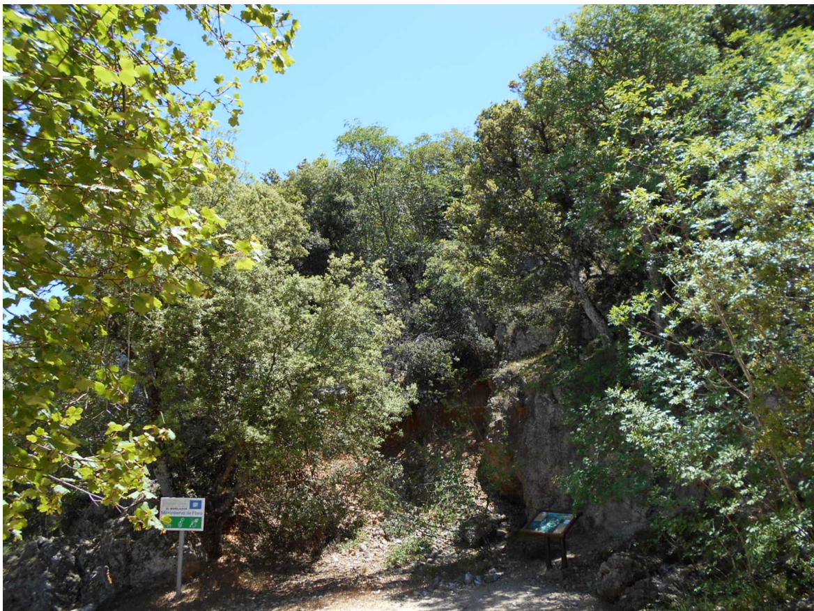
Vista de la microreserva, en la qual s'observen les formacions de boscos mixtos, carrascars i rouredes.