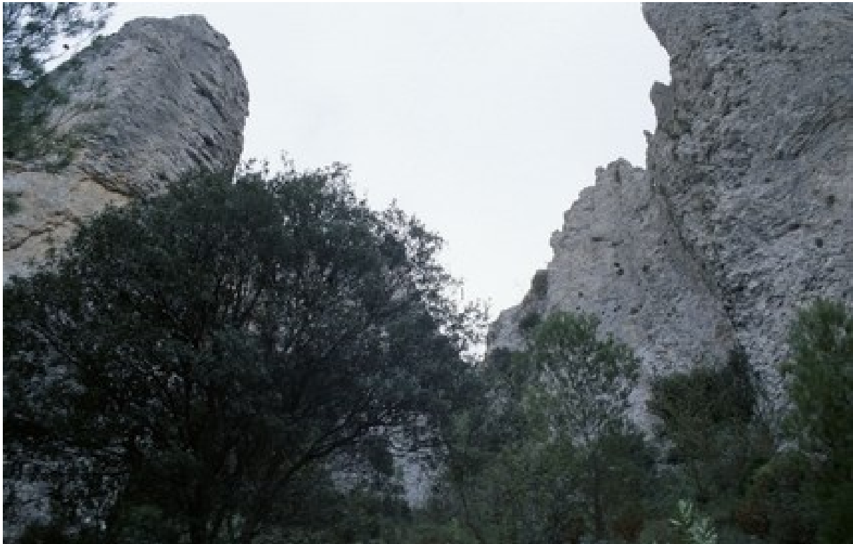
Vista de la microreserva, en la qual s'observen les comunitats d'espècies rupícoles i la comunitat de boscos amb teixos.

http://www.dogv.gva.es/datos/2010/06/10/pdf/2010_6390.pdf