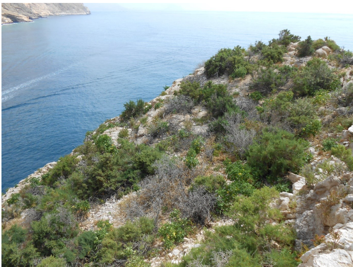
Vista de la microrreserva en la que se observan las comunidades de matorrales halonitrófilos.