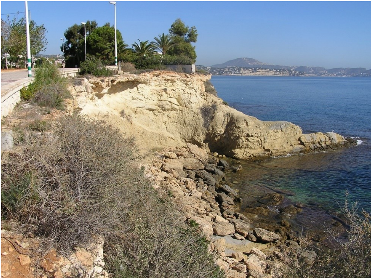
Vista de la microreserva en la qual s'observen les comunitats de penya-segats litorals.