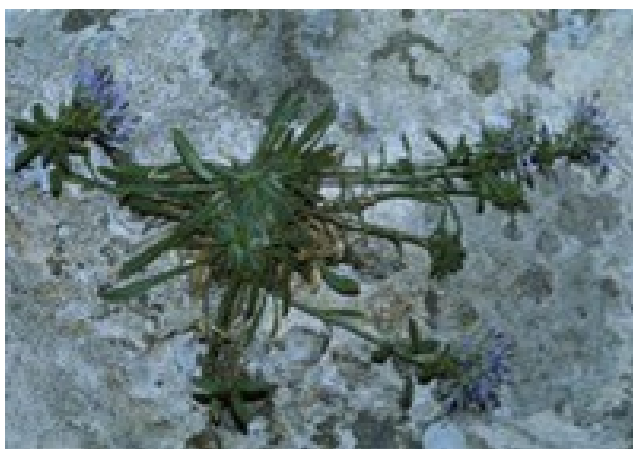
Linaria cavanillesii (esquerra) és un endemisme iberollevantí que podem trobar en els clivells dels penyals de les muntanyes alcoiano-diàniques. Per altra banda, Jasione foliosa (dreta) és pròpia de les penyes ombroses de les muntanyes més elevades del nord de la província d'Alacant i del sud i centre de la de València.