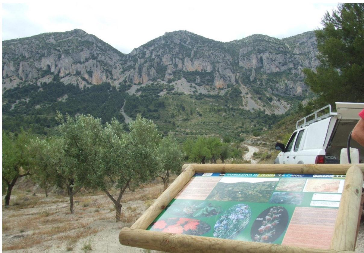
Vista de la microreserva en la qual s'observen les comunitats rupícoles, de runars i de carrascars.

http://www.dogv.gva.es/datos/2005/11/03/pdf/2005_12039.pdf