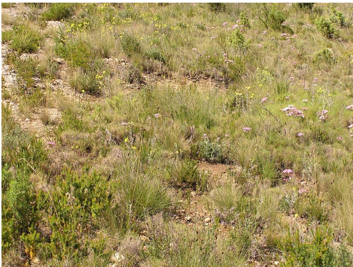
Vista de la microreserva, en la qual s'observen els prats rics en espècies bulboses.