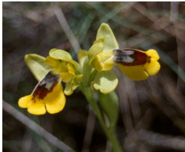
Dues de les orquídies que trobem en aquestes brolles aclarides: Ophrys incubacea (esquerra) i Ophrys lutea (dalt).

Tipus d'hàbitats (Codi Natura 2000)(Hàbitat prioritari*)