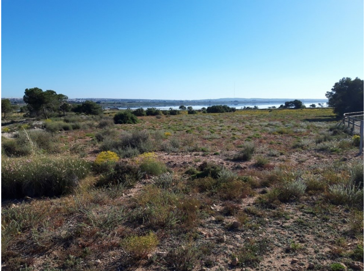
Vista de la microreserva en la qual s'observen els prats on creix l'orquídia Anacamptis collina .

http://www.dogv.gva.es/datos/2010/06/10/pdf/2010_6390.pdf