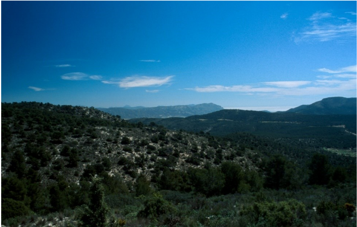
Vista de la microrreserva, en la que se observan los matorrales y las comunidades de pastizales cársticos.