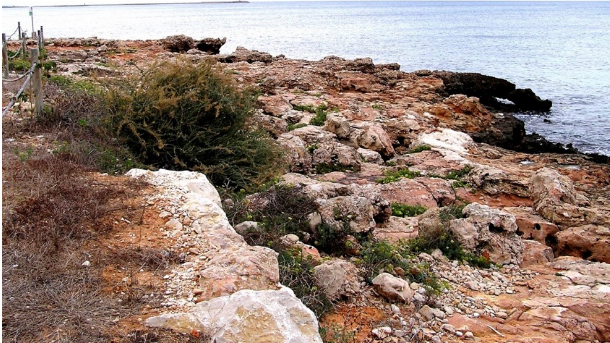
Vista de la microreserva, en la qual s'observen les comunitats de penya-segats litorals amb ensopegueres endèmiques.