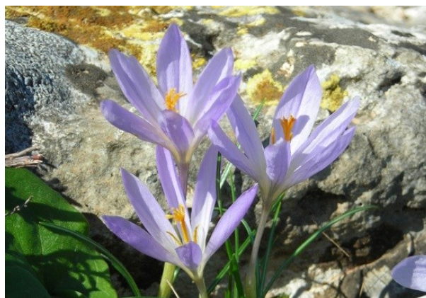
Dos de las especies de geófitos de floración otoñal propias de los pastizales de montaña: Merendera montana (izquierda) y Crocus salzmannii (derecha).