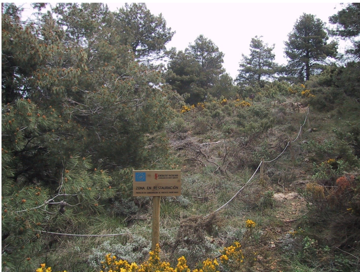
Vista de la microrreserva, en la que se aprecian los trabajos de control de la vegetación y la parcela en la que se han realizado las labores de colonización asistida.