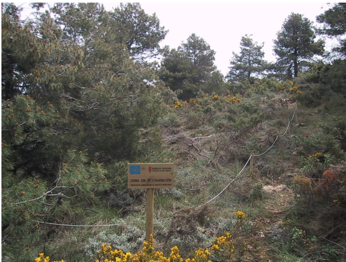
Vista de la microreserva, en la qual s'observen els treballs de control de la vegetació i la parcel·la en la qual s'han fet les tasques de colonització assistida.