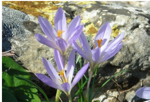
Dues de les espècies de geòfits de floració tardorena pròpies dels prats de muntanya: Merendera montana (esquerra) i Crocus salzmannii (dreta).

Tipus d'hàbitats (Codi Natura 2000)(Hàbitat prioritari*)