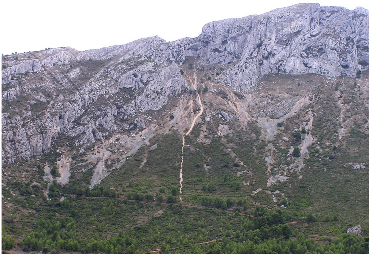
Vista de la microrreserva en la que se observan las comunidades rupícolas y las propias de canchales.

http://www.dogv.gva.es/datos/2001/01/30/pdf/2001_670.pdf