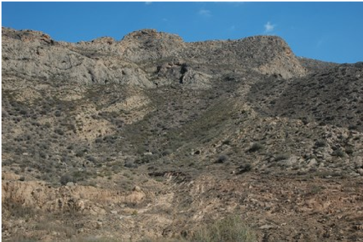
Vista de la microrreserva, en la que se observan las comunidades de especies rupícolas y los matorrales termomediterráneos.

http://www.dogv.gva.es/datos/1999/05/28/pdf/1999_4785.pdf