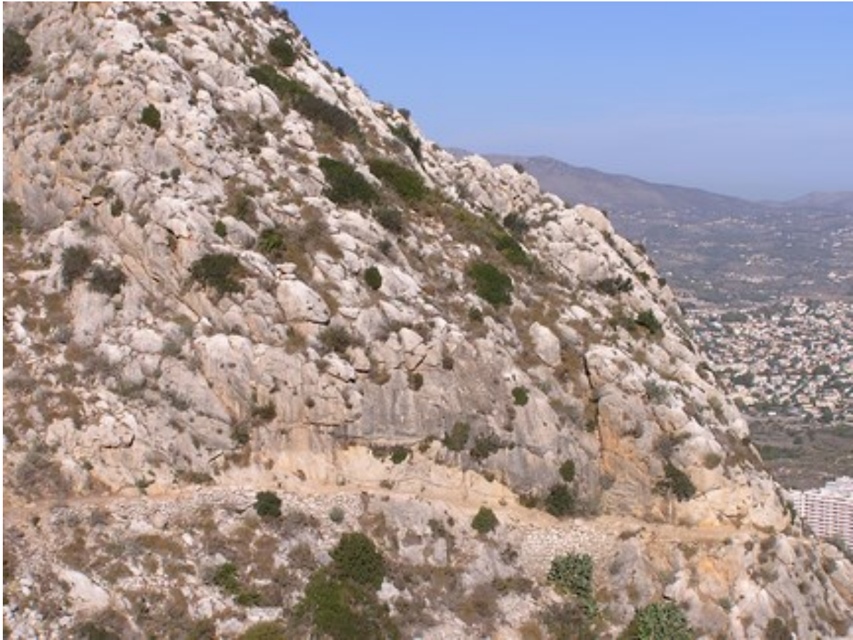
Vista de la microrreserva, en la que se observan las comunidades de especies rupícolas.

http://www.dogv.gva.es/datos/1999/05/28/pdf/1999_4785.pdf