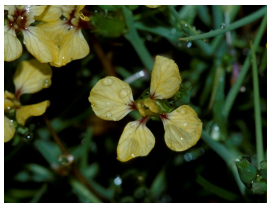
Dos dels arbusts espinosos que formen part dels matollars pulvinulars d'alta muntanya: Genista longipes (esquerra) i Vella spinosa (dreta).