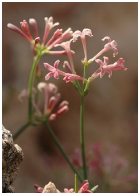
Silene hifacensis (esquerra) és una de les espècies amenaçades valencianes més emblemàtiques. Asperula pau subsp. dianensis (dreta), és un endemisme diànic de les serres litorals des de Dénia al Mascarat.