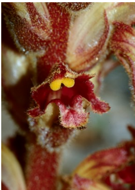
Cephalanthera rubra (esquerra) és una orquídia característica de carrascars ombrívols, rouredes i boscos mixtos en bon estat de conservació. Orobanche gracilis (dreta) és una espècie paràsita de lleguminoses llenyoses de matolls secs.