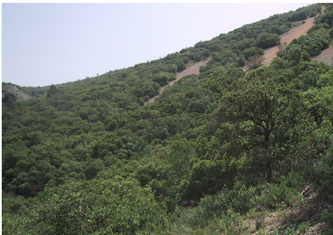
Vista de la microreserva en la qual s'observen el carrascar i les comunitats de runars.