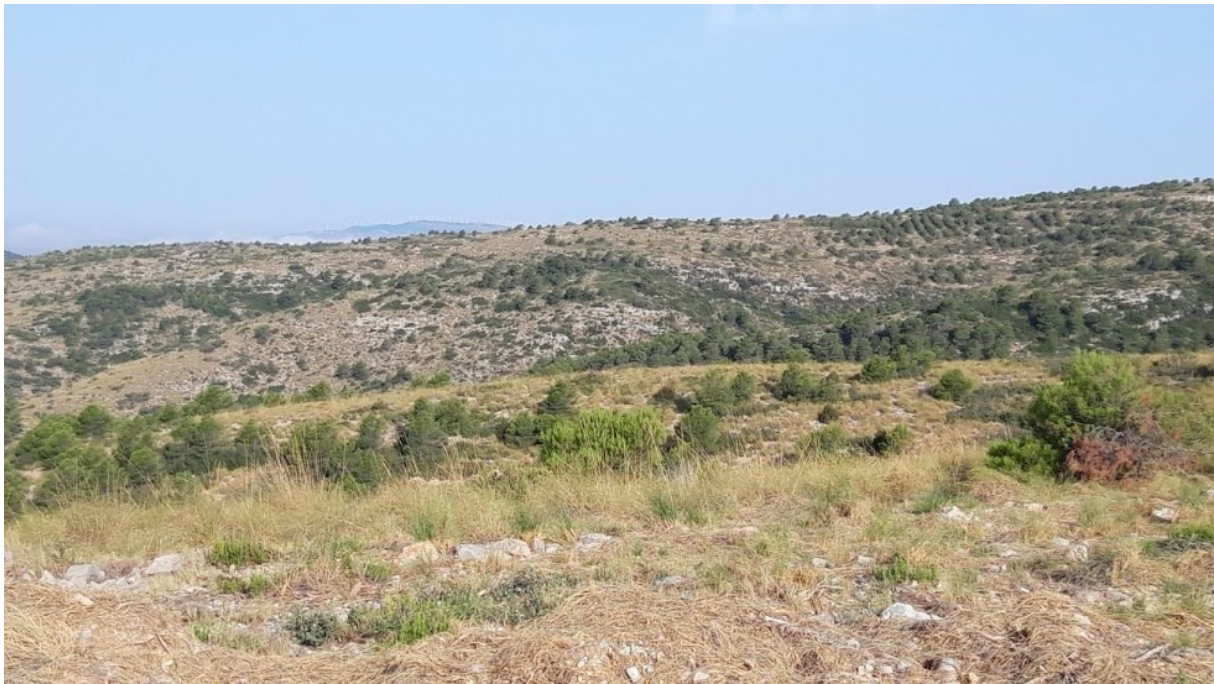
Vista de la microreserva, en la qual s'observen comunitats de prats i matolls en mosaic.