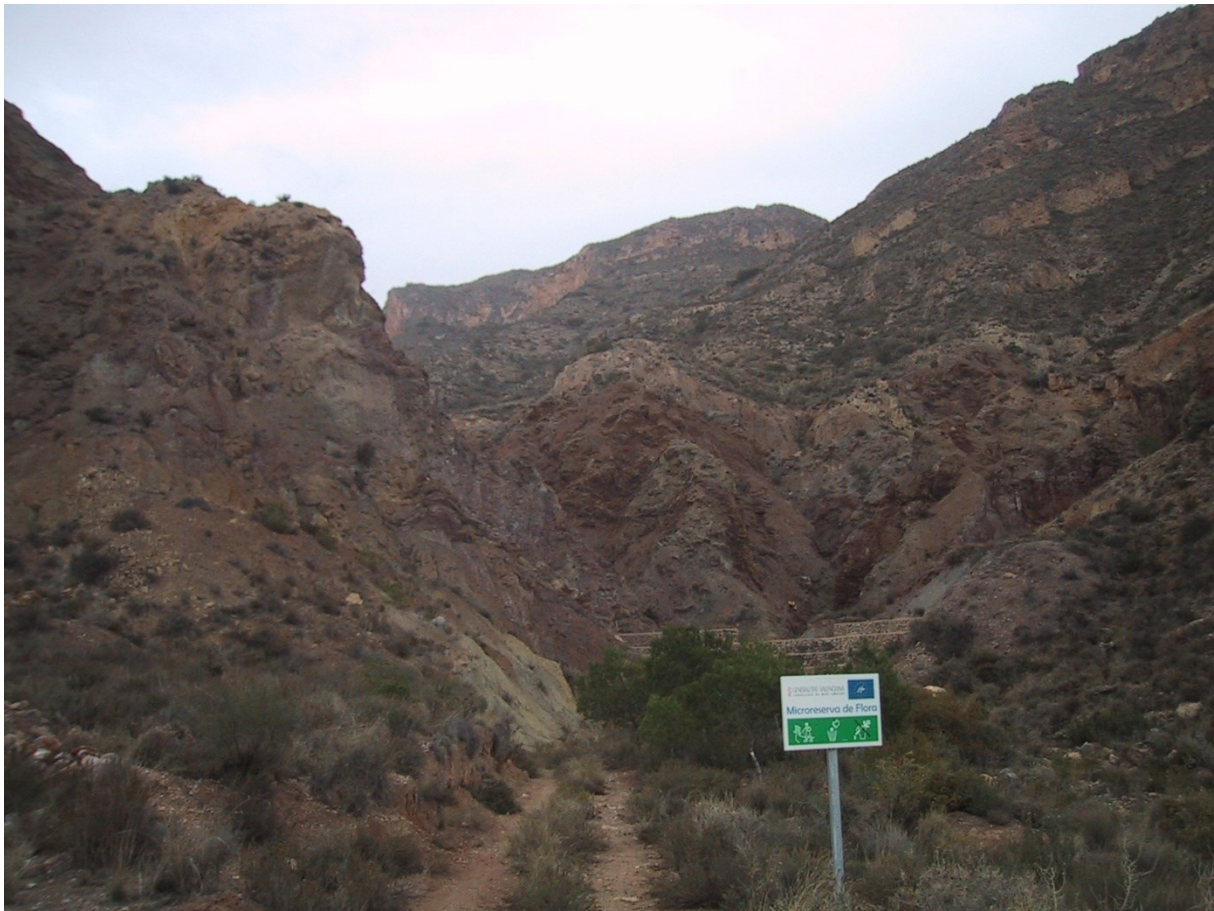
Vista de la microrreserva microreserva en la qual s'observen les comunitats vegetals d'espècies gipsícoles.