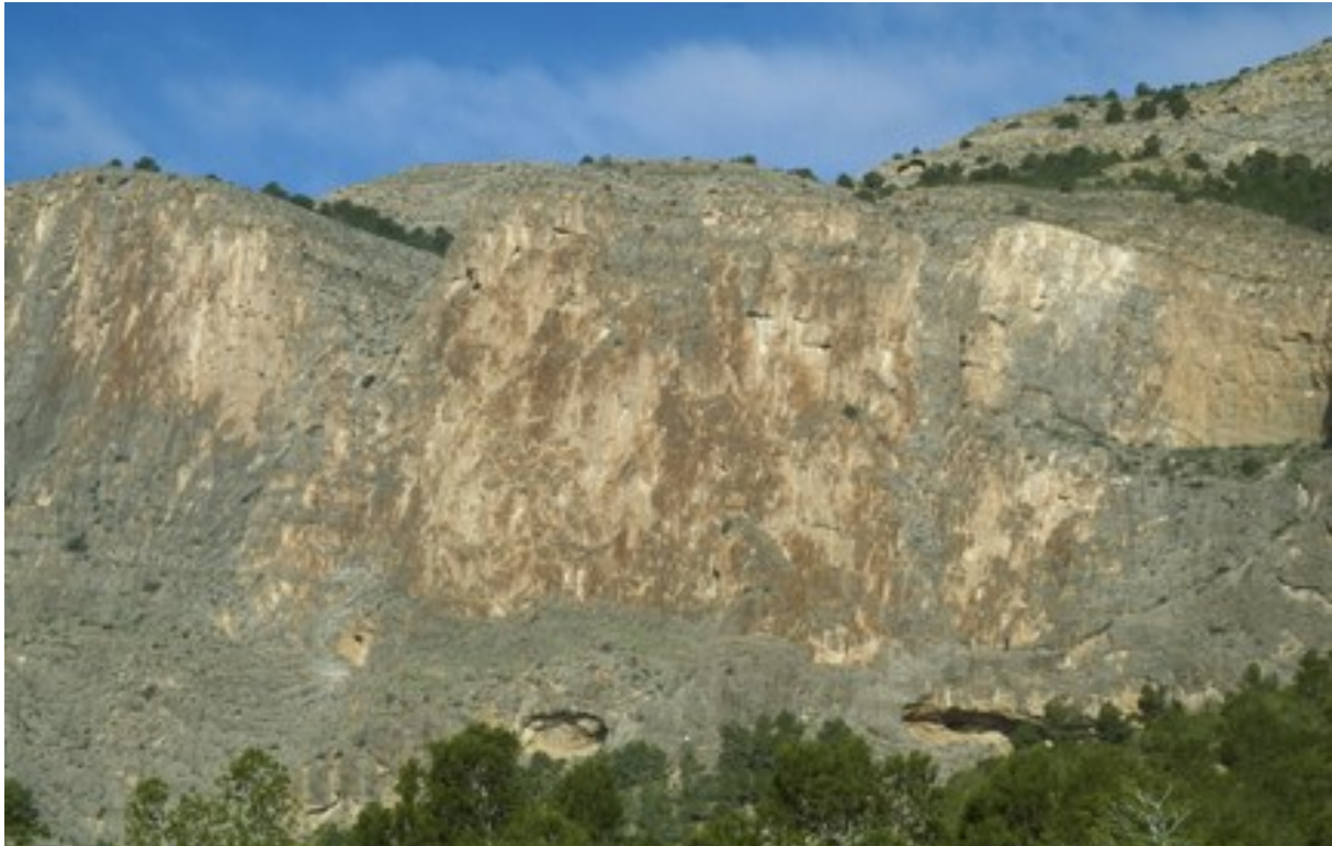
Vista de les parets on creixen les comunitats d'espècies rupícoles.

http://www.dogv.gva.es/datos/1999/05/28/pdf/1999_4785.pdf