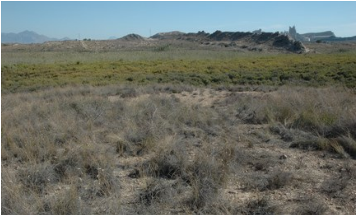
Vista de la microreserva en la que se observan los albardinares (en primer término) y el saladar húmedo.

http://www.dogv.gva.es/datos/2001/08/07/pdf/2001_7555.pdf