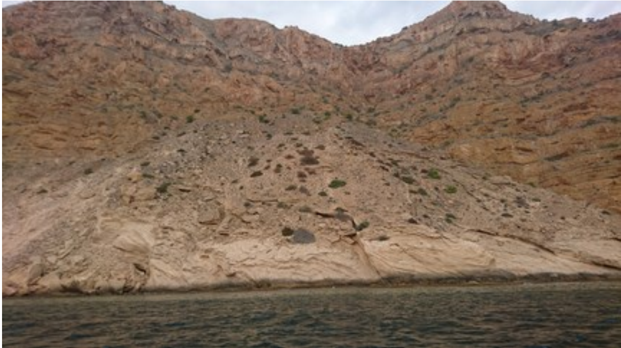
Vista de la microreserva en la qual s'observa la comunitat d'espècies psammòfiles.

http://www.dogv.gva.es/datos/2020/04/24/pdf/2020_3038.pdf