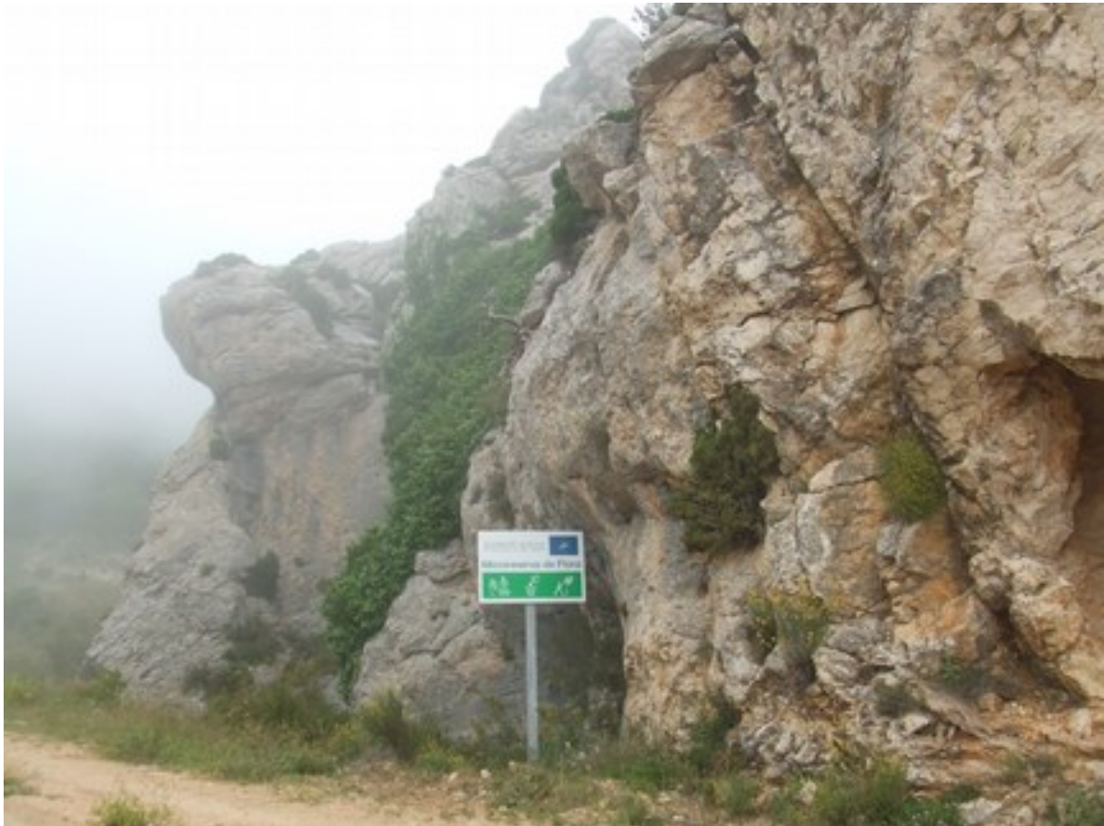
Vista de la microreserva en la qual s'observen les comunitats d'espècies rupícoles.

http://www.dogv.gva.es/datos/2001/01/30/pdf/2001_670.pdf