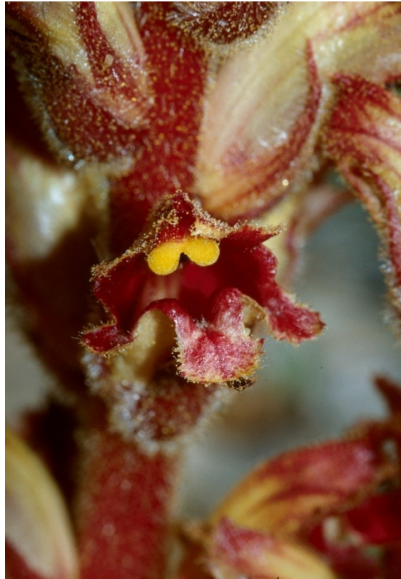
Linaria depauperata subsp. depauperata (izquierda) es un endemismo exclusivo valenciano, bastante extendido por las montañas alcoyano-diánicas, Orobanche gracilis (derecha) es una especie parásita de leguminosas leñosas de matorrales secos.