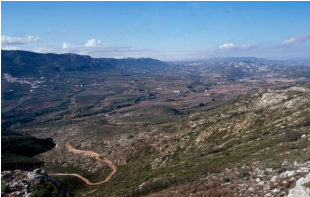
Vista de la microrreserva en la que se observan los pastizales y matorrales en mosaico.