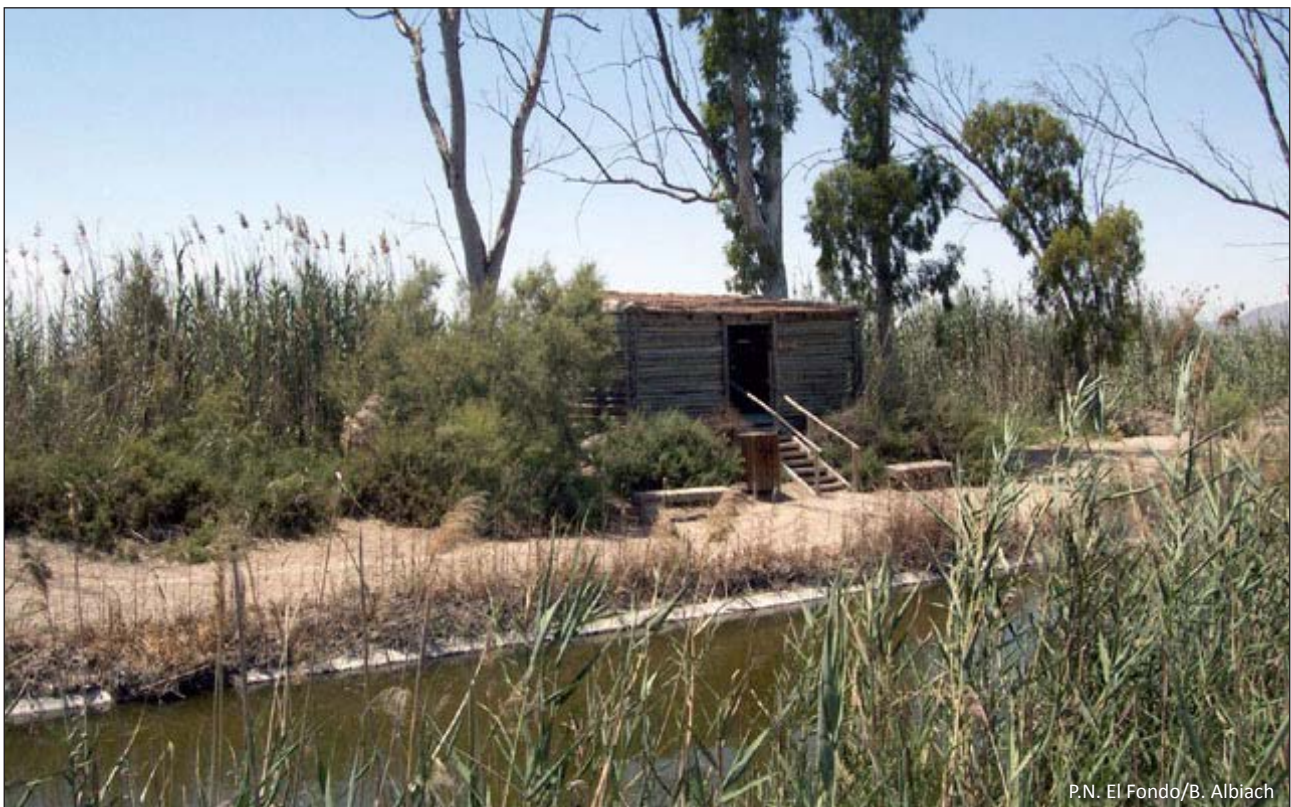
P.N. El Fondo/B. Albiach