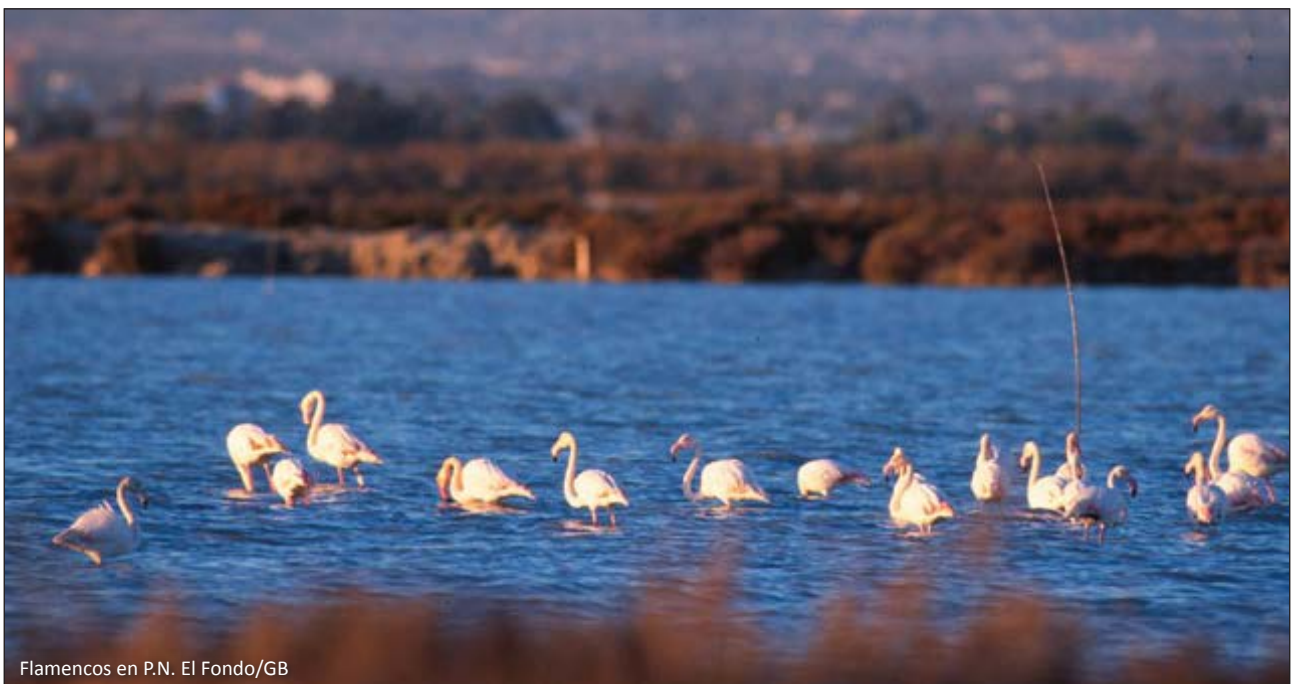
Flamencos en P.N. El Fondo/GB