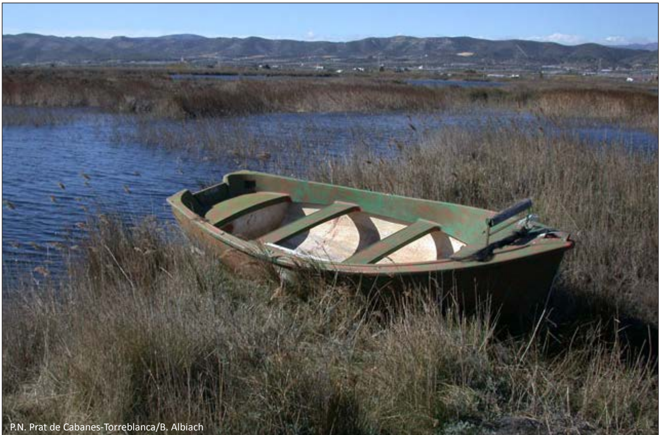
P.N. Prat de Cabanes-Torreblanca/B. Albiach