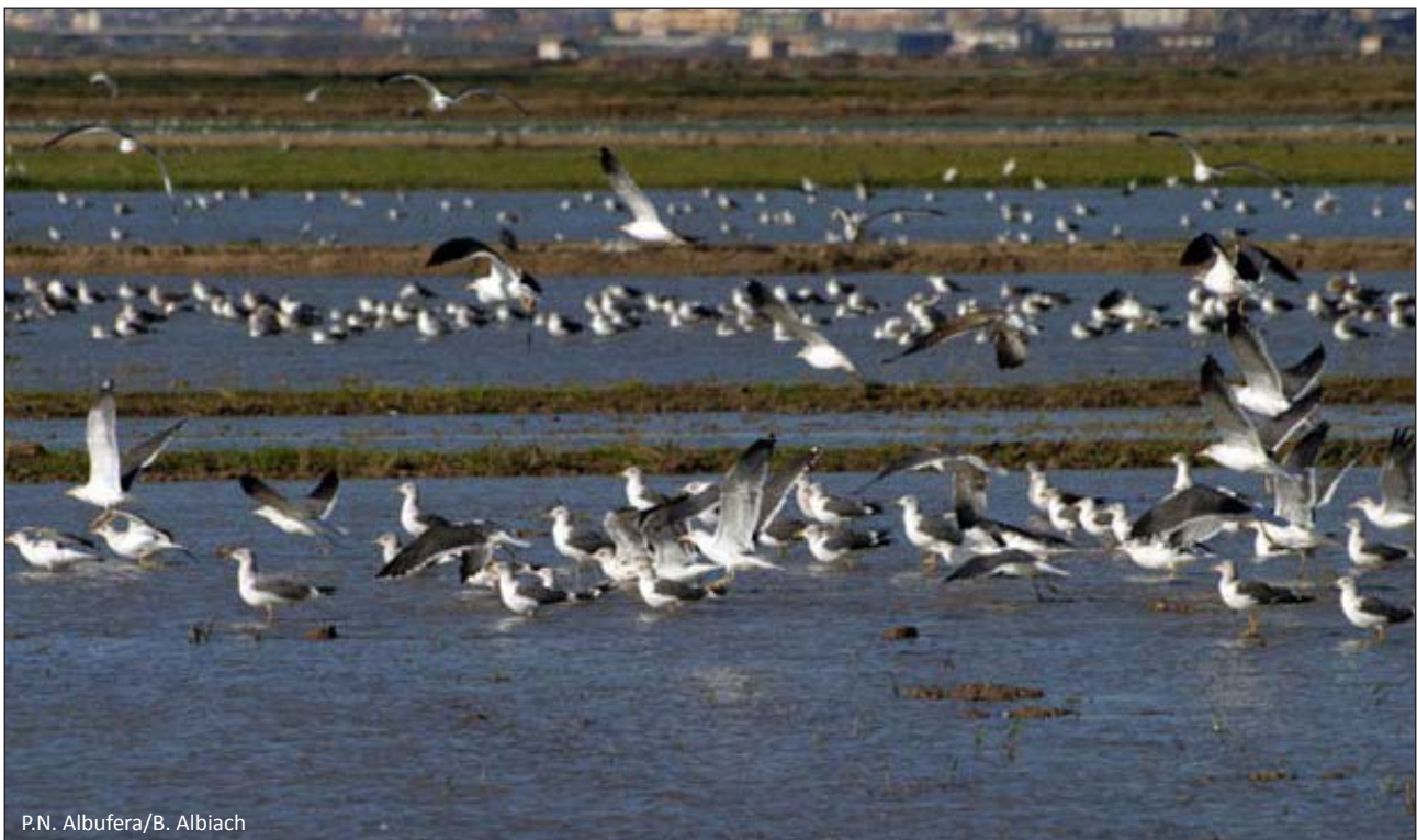
P.N. Albufera/B. Albiach