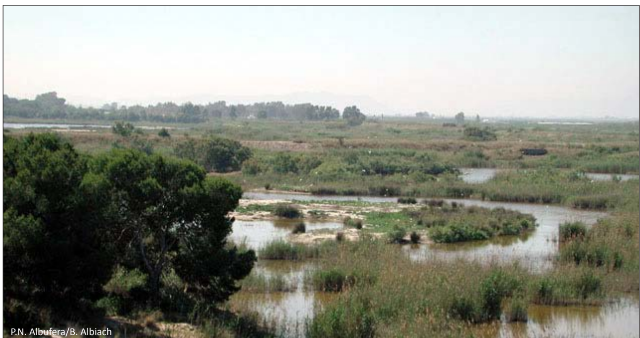
P.N. Albufera/B. Albiach