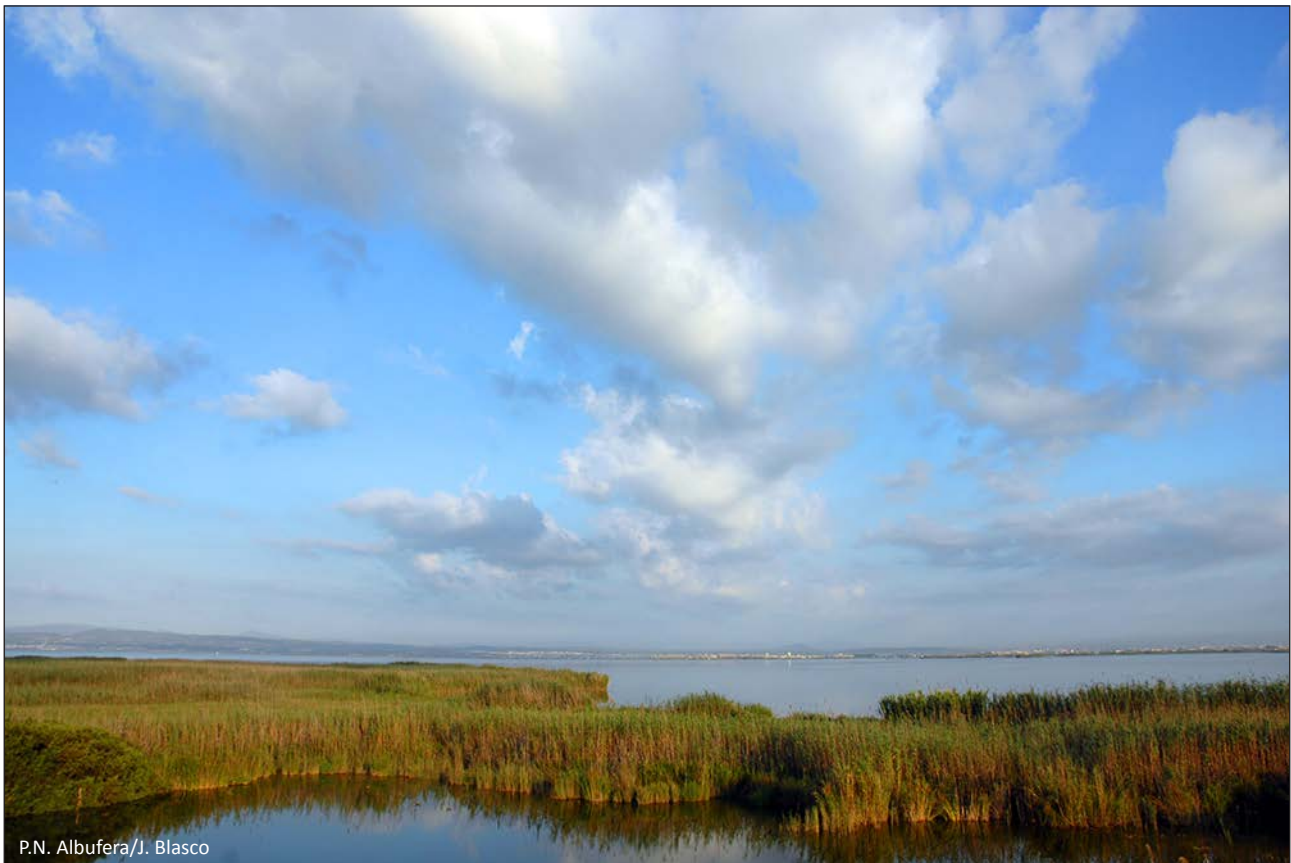
P.N. Albufera/J. Blasco

Ha sido compilado por: Juan Antonio Gómez López. Servicio de Vida Silvestre.