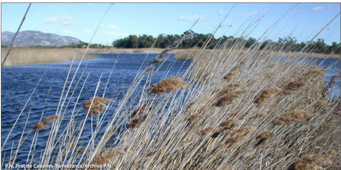
P.N. Prat de Cabanes-Torreblanca