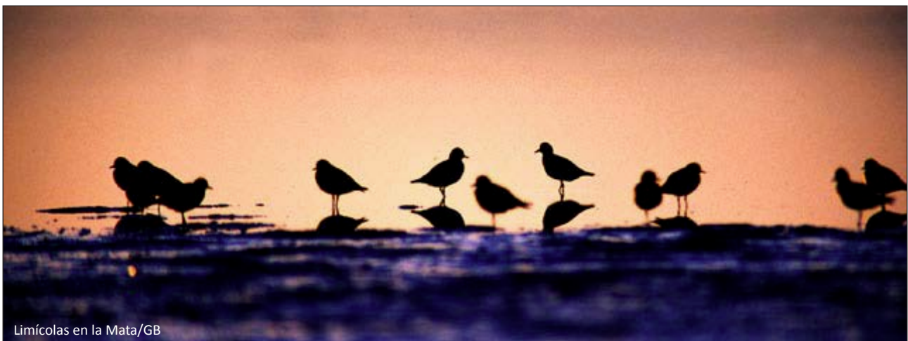
Limícolas en la Mata/GB