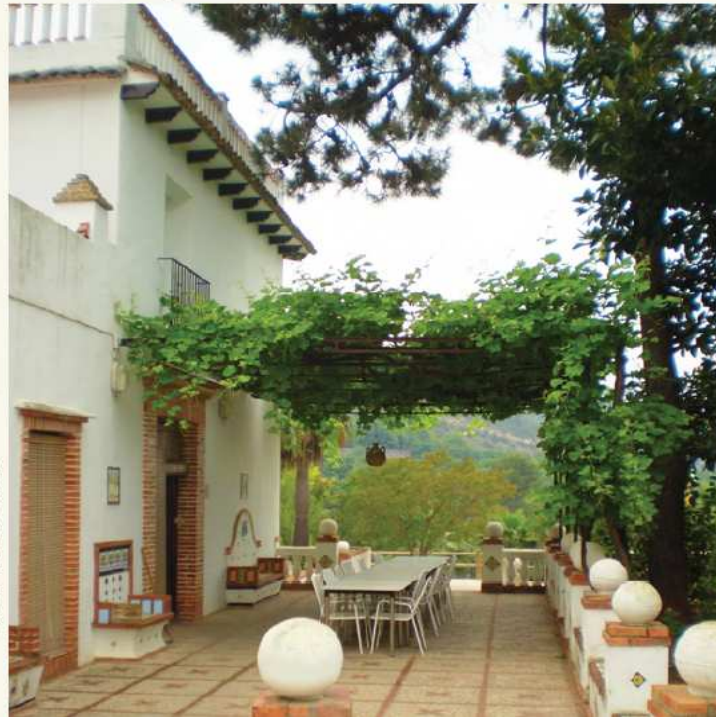
Hort de Soriano