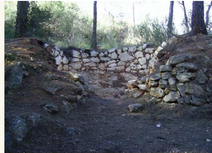
Forn de calç